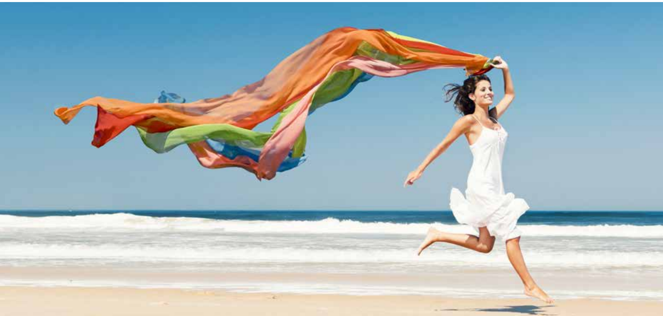
Tabella Classe Schermatura Solare Tessuti Arquati Suncolor - Tessuti Tecnici

Versione 6 Del 05/2018 Vademecum Operativo